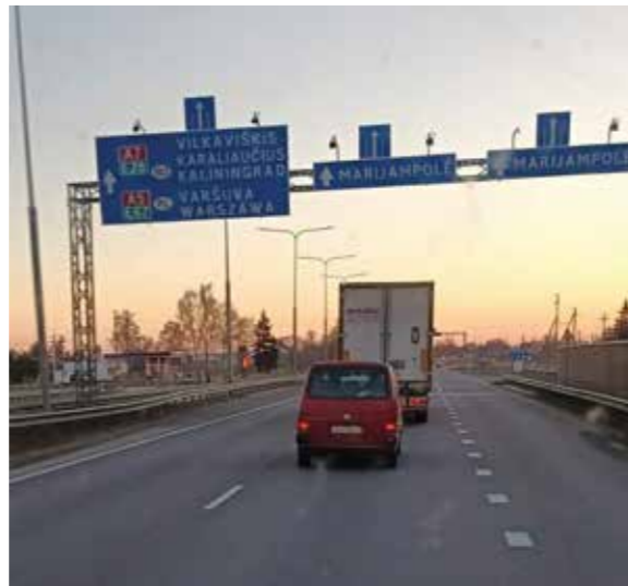
Matkalla Puolasta Ukraina.