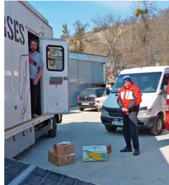
Kuorma purettiin Ukrainassa, Nikolajevin kaupungissa, 120 km Puolan rajalta. Vastaanottava seurakunta alkoi heti kuljettaa apua kiireellisempiin kohteisiin.